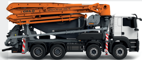
Brazo de Distribución MK28L-5"